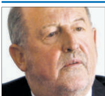
«Vielleicht hätten wir noch früher mit der Information beginnen sollen.»

Was würden Sie im Nachhinein anders machen?